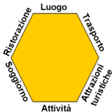
5. La decisione del consumatore può essere rappresentata da un esagono costituito dalle diverse componenti in gioco.

Le compagnie aeree low cost hanno abbattuto notevolmente i costi di trasporto, offrendo ai viaggiatori maggiore libertà nella scelta delle destinazioni finali e minori preoccupazioni per le spese da affrontare per raggiungerle. E' possibile comprendere l'importanza del fattore costi di trasporto se si considera che l'87% degli europei non si reca fuori dai confini dell'Europa a causa degli elevati costi di trasporto.